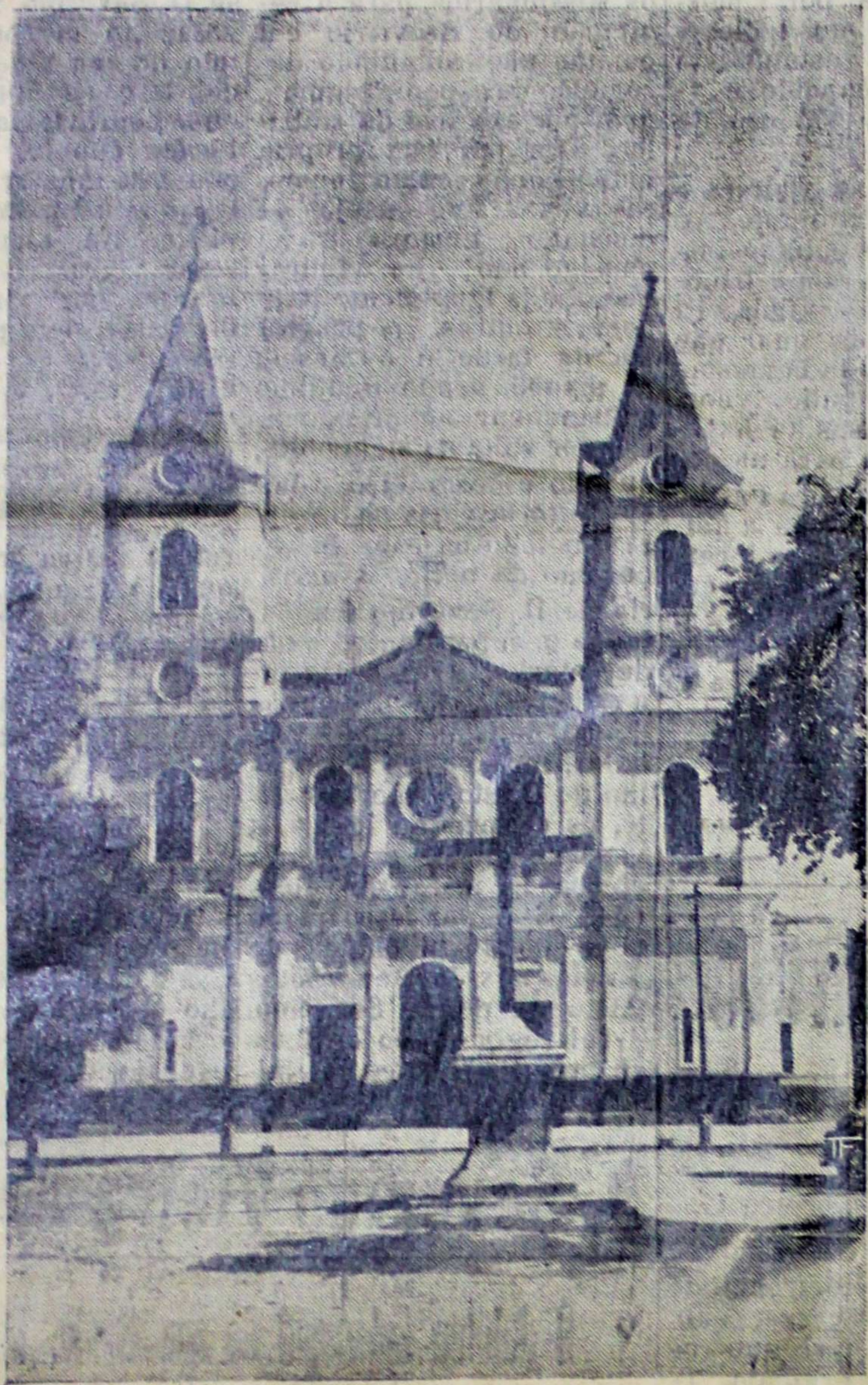
Igreja Catedral de Nossa Senhora das Dóres, inteiramente remodelada por Dom Severino.